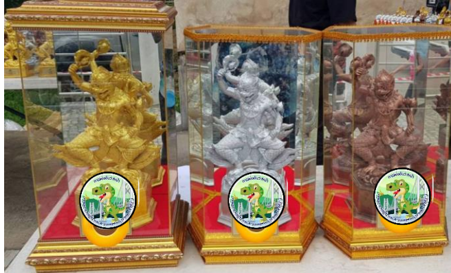
ถ้วยบุคคล