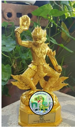
เหรียญรางวัล